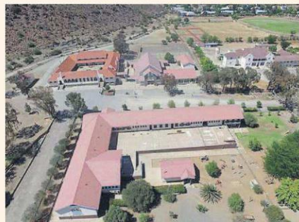
Die Hoërskool Colesberg.