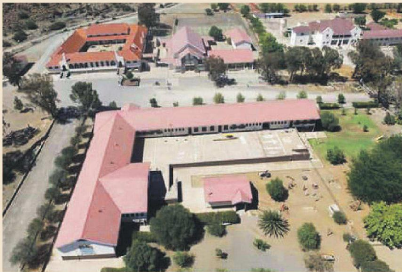
Die Hoërskool Colesberg, waar die waarnemende hoof en nog vier onderwysers op 15 April skielik siek geword het.